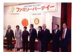
ファミリーパーティー (12月5日)