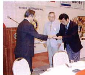
士別市体協、サフォークサッカークラブに寄贈 (8月1日)