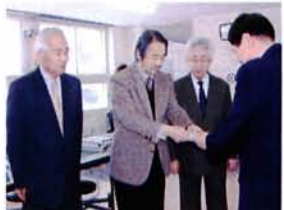
通算で約222万円となった士別市社協への寄付 (12月16日)