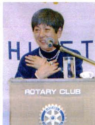
軽妙な語り口でお話する和泉氏

[和泉氏プロフィール=和泉様は東京銀座生まれ、10歳で劇団若草に入団。14歳で日活に入社。1963年の映画「非行少女」では第3回モスクワ映画祭の金賞を受賞。70年代からテレビ、舞台でも活躍。89年には北極点に到達。著書に「私だけの北極点」(講談社)などがある]