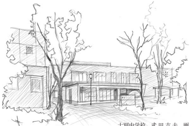
士別中学校 武田吉夫 画