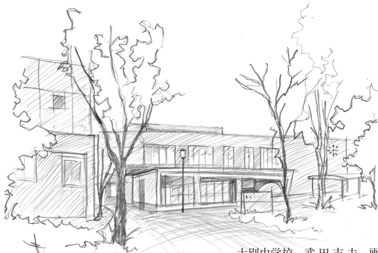
士別中学校 武田吉夫 画