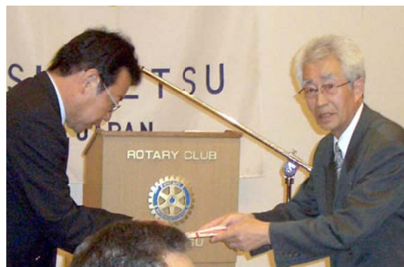
吉倉会長に贈呈する織戸会長