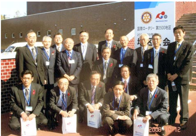
釧路市での地区大会に参加した一行

基調講演、記念講演等の内容については、地区大会報告書に記載されてますので、ご一読ください。