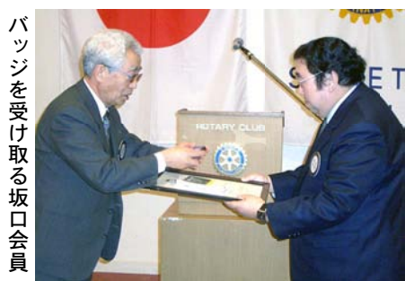
バッジを受け取る坂口会員