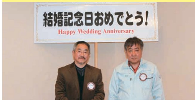
近井孝義・汐川泰晴 2名の会員が今月結婚記念日を迎えます。 おめでとうございます。