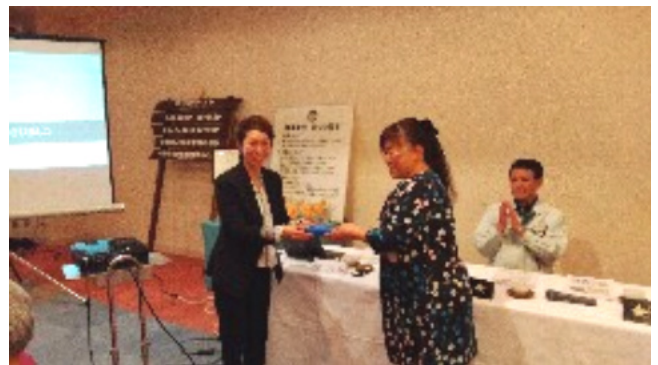
会長より記念品贈呈